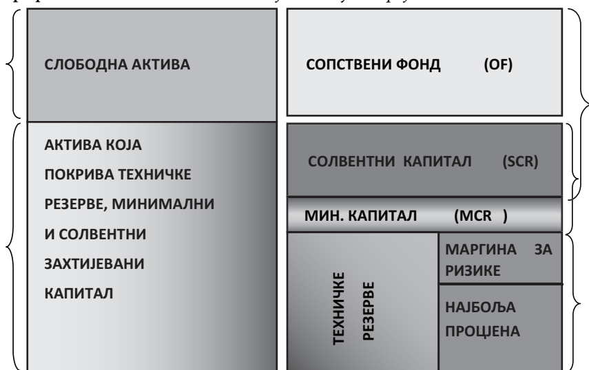
Графикон 2. Квантилитативни захтијеви, Стуб I, пројекат „Солвентност II”

Такође, један од предлога CEIOPS-а је да имовина, коју би требала посједовати осигуравајућа компанија у циљу обезбјеђења сигурности, приноса и бољег маркетинга инвестиција, треба да омогући покриће техничке резерве, захтијеваног минималног и захтијеваног солвентног капитала, на шта указује и графикон бр.2.